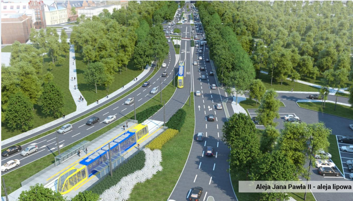
Aleja Jana Pawła II - aleja lipowa

AL. ŚW. JANA PAWŁA II – WIDOK OD STRONY PL. NIEPODLEGŁOŚCI