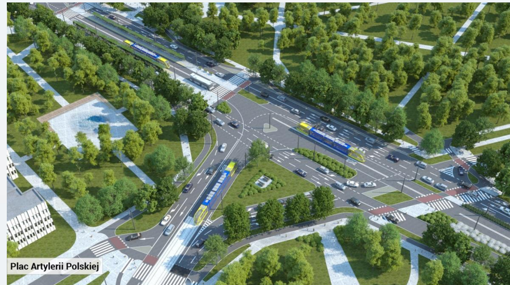
Plac Artylerii Polskiej

SKRZYŻOWANIE ULIC: AL. ŚW. JANA PAWŁA II/ WAŁY GEN. SIKORSKIEGO/ AL. NIEZALEŻNEGO ZRZESZENIA STUDENTÓW UMK